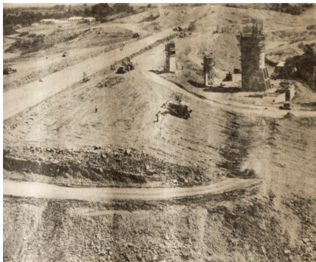
Instituto Colombiano de la Reforma Agraria- INCORA. Serie de divulgación Proyectos No. 1. Bolívar No. 1. Mahates, Marialabaja, Arjona. Octubre 1968.

En 1960 Colombia adoptó el programa “Alianza para el Progreso”, recibiendo recursos provenientes de Estados Unidos. Los recursos no eran solo dinero, incluían una serie de estudios y recomendaciones, todo ello enfocado a superar la pobreza. Para el sector agrario, se pensó en maximizar la producción a través del programa de “Revolución verde”. Así, para la década de 1960 (abarcando 1966, año en el que